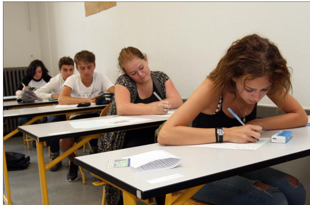
Hier après-midi, les collégiens ont planché sur l'épreuve de maths avant d'enchaîner avec SVT et sciences physiques.