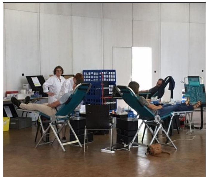
Le don a été organisé au centre de communication de Smartville, espace situé près de l'usine qui fabrique la petite citadine.

Une centaine d'employés du site de la Smart ont répondu à l'appel hier. Une première qui pourrait être renouvelée.