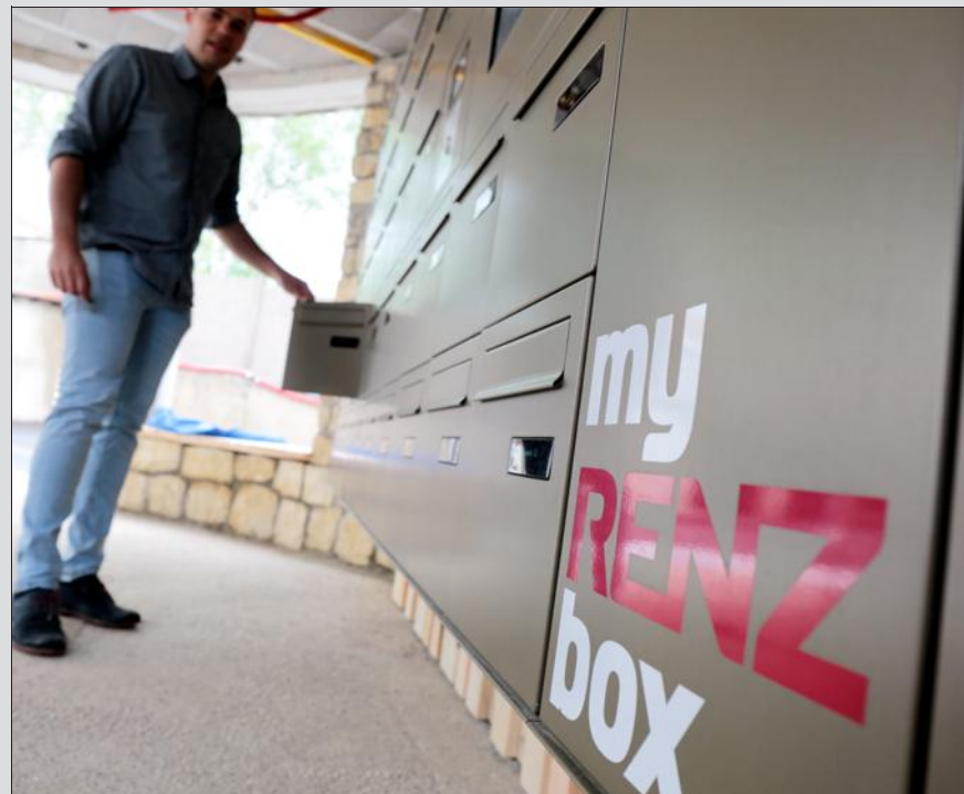
La résidence l'Odyssée est équipée du premier ensemble d'e-conciergerie du Grand Est.

Depuis la commercialisation de la gamme connectée en janvier, dix commandes ont été passées en France ; une soixantaine en Europe (Allemagne, Danemark, Suède...) pour équiper